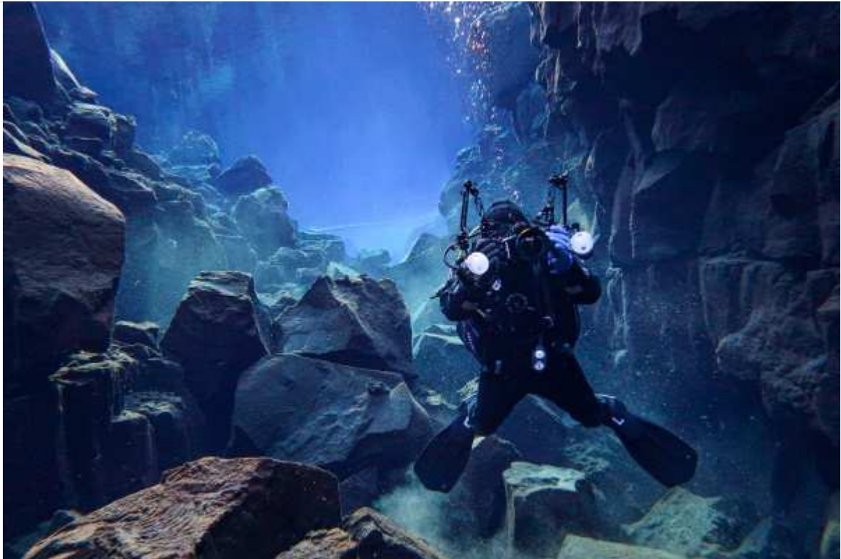
Mooie foto's van een duik in Daviðsgjá, IJsland: The Underwater Cathedral Of Ice, Rock And Light: Diving Daviðsgjá