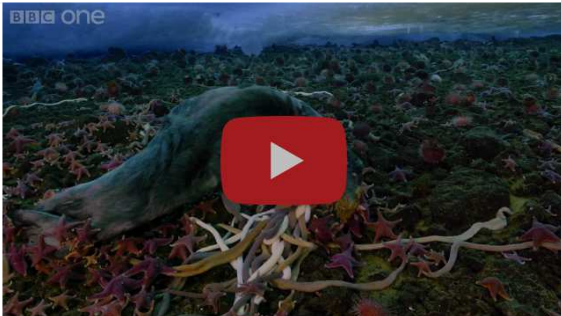
Monsterwormen en zeesterren op de bodem bij McMurdo (Antarctica) (Versnelde beelden)